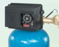
Fleck 2850 1 1/2''